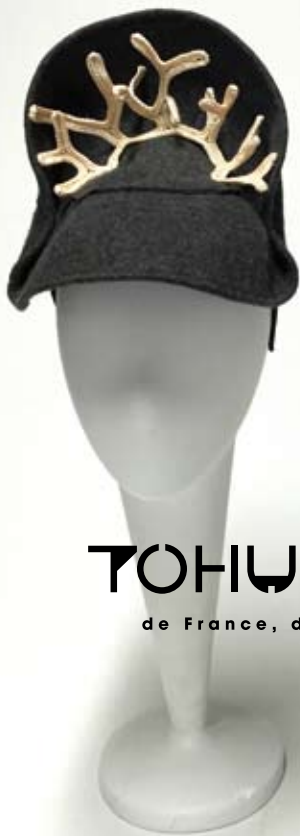
Le Grand Cerf