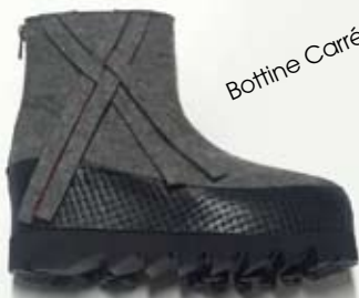
Bottine Carré d'As