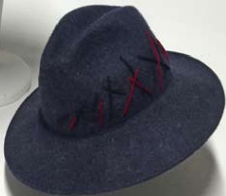
Le Saut du Loup